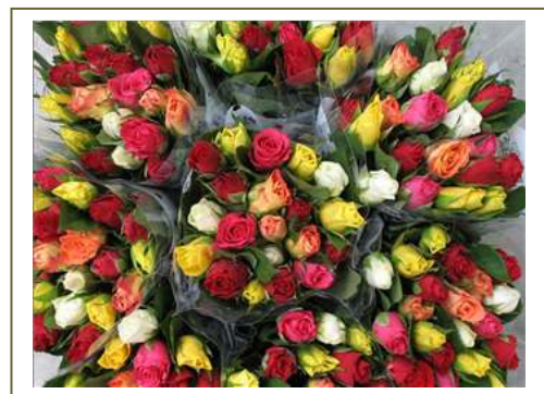
Een bloemetje voor alle deelnemers!