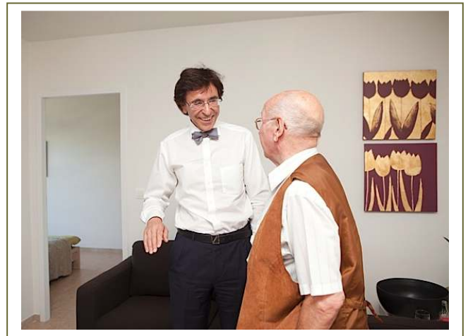
De premier krijgt wat meer uitleg van een bewoner

De premier maakte er kennis met enkele bewoners van De Meere, bezocht er een gerenoveerde serviceflat en kreeg wat meer uitleg over het Home Sweet Home project en haar doelstellingen.